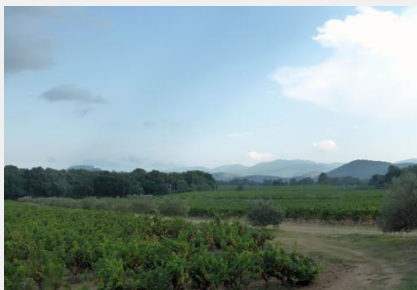
l'AOC Côte de Provence sortie 36, La Provençale (A8)

inviter le voyageur à une pause dans des lieux ou établissements situés proches d'une sortie