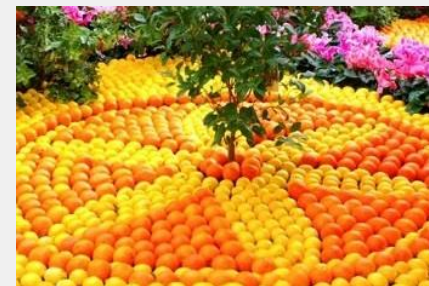
la Fête du Citron, sortie 59, La Provençale (A8), fin février / début mars

promouvoir une actualité locale (festival, événement, etc.)