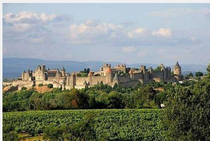
la Cité de Carcassonne, vue depuis l'autoroute des Deux Mers (A61)

faire connaître, au passage, un territoire ou un élément remarquable du paysage